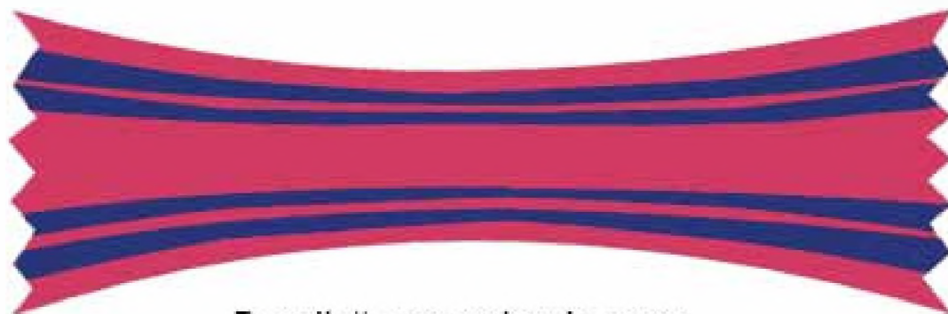
Panglică comandor de pace